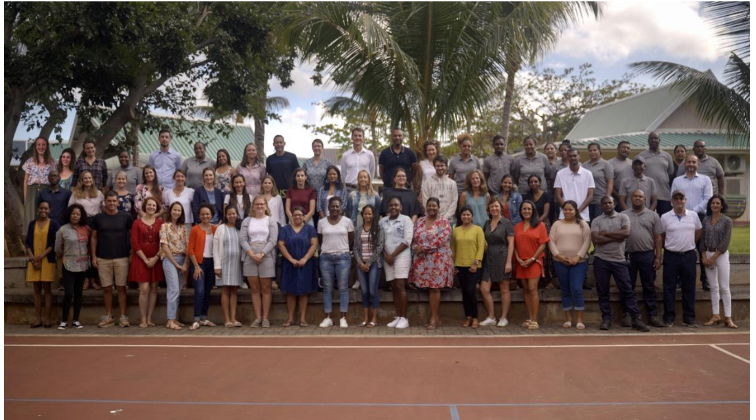
Photographie prise à la rentrée 2022

Plus de 65 employés de l'école Paul et Virginie assurent le service de qualité :